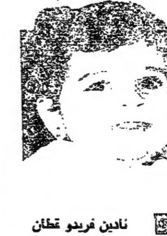
نادين فريدو تطان